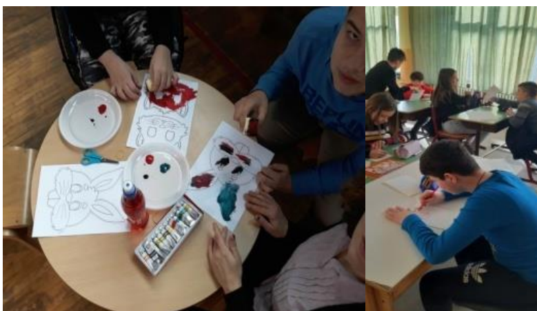
Slika 7 i 8. Završno slikanje/crtanje

Ukoliko želite može se uraditi zajednički likovni rad, gdje djeca iz razreda oslikaju drvo prijateljsva kroz bojenje i prislanjanjem na hamer papir, gdje se formira drvo od obojenih dječijih radova.