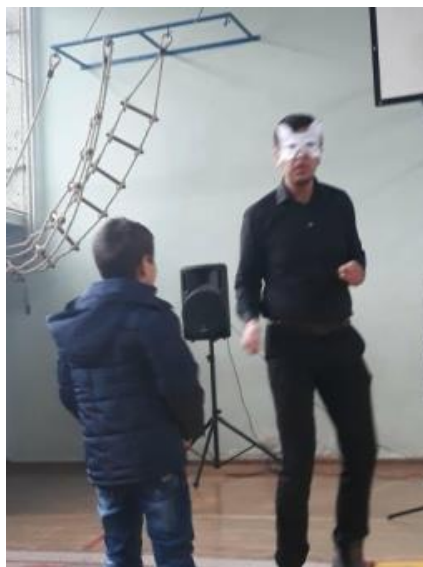
Slika 4. Uloga vuka/ razgovor sa učenikom s teškoćama u razvoju

Klovn se povlači iza vrata gdje se presvlači u vuka I izlazi pred djecu, gdje se dalje nastavlja dramatzacija.