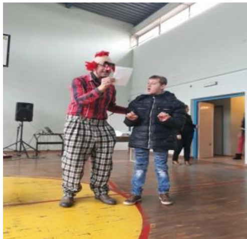
Slika 5. Animacija učenika s teškoćama u razvoju

KLOVN: Pozdrav drugari moji, hvala vam što ste prihvatili mog drugara vuka kao svog drugara.