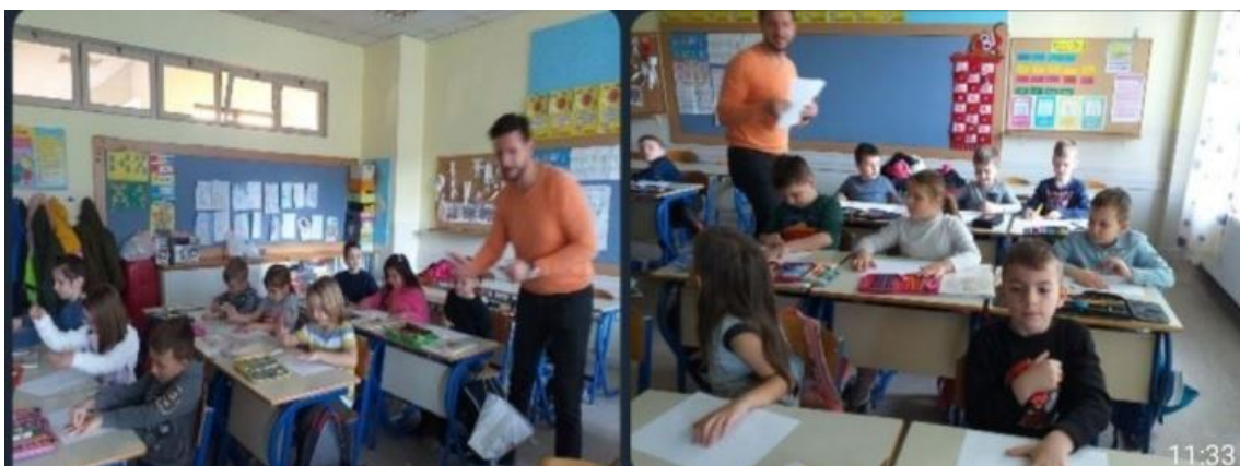
Slika 1 i 2. Pripremno predavanje

U uvodu voditelj izlaže kratko obrazloženje koliko smo različiti , a koliko smo slični: