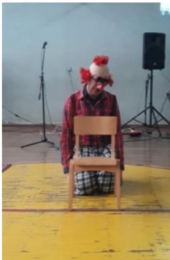
Slika 3. Početak dramatizacije klovna

Tokom govora, voditelj se lagano preoblači u klovna. Po završetku govora počinje klovna da priča svoju priču sa tekstom: