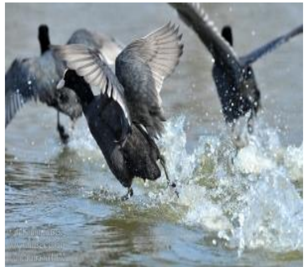
Prilog br. 2 Ptice Sarke u pripremi za polijetanje