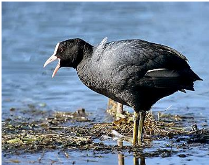
Prilog br. 1 Ptica Sarka