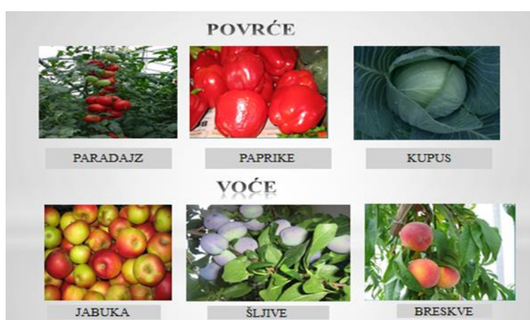
Slajd 2.: Povrće i voće

Prezentacija se sastoji od slajdova koji prikazuju slike sa biljkama koje čovjek koristi u ishrani: povrće, voće, žitarice, industrijsko bilje, krmno bilje, ljekovito bilje i jestive sjemenke.