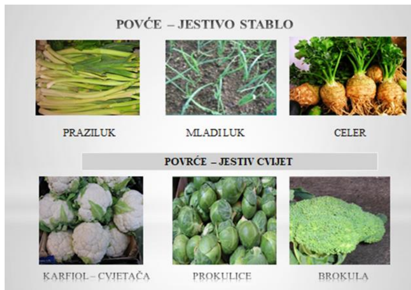
Slajd 9.: Povrće kod kojih koristimo jestivo stablo i jestivi cvijet

Prelazimo na prezentaciju biljaka voća. Učenici prepoznaju biljke voća i razgovaramo o njima. Dolazimo do zaključaka voće sadrži važne voćne šećere. Kako da ga koristimo u ishrani i da se voće dijeli po obliku ploda.