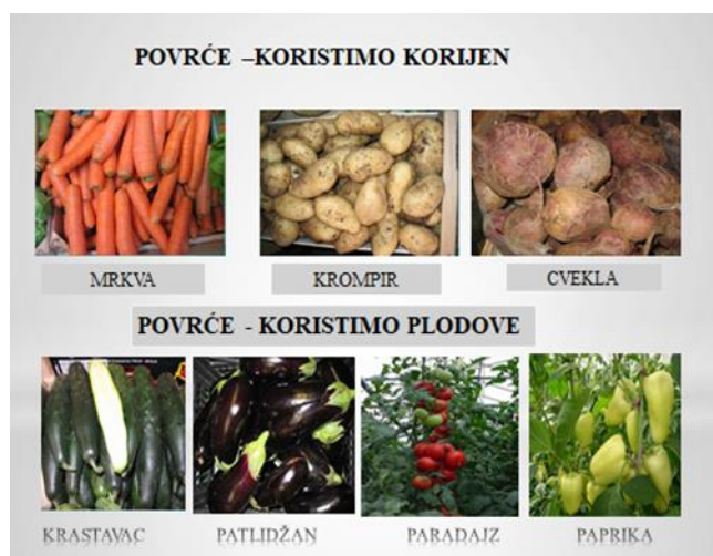
Slajd 8.: Povrće kod kojih koristimo korijen