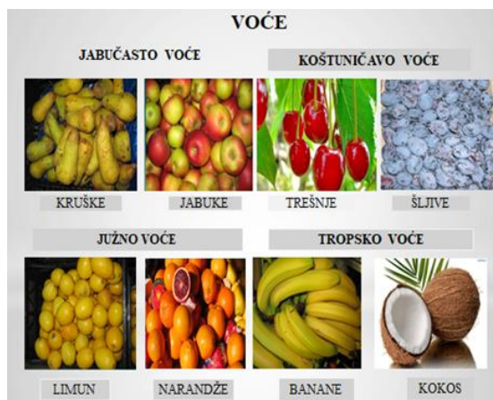
Slajd 10.: Oblici olodova voća

Prelazimo na prezentaciju biljaka voća. Učenici prepoznaju biljke voća i razgovaramo o njima. Dolazimo do zaključaka voće sadrži važne voćne šećere. Kako da ga koristimo u ishrani i da se voće dijeli po obliku ploda.