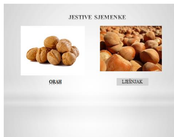
Slajd 11.: Jeestive sjemenke