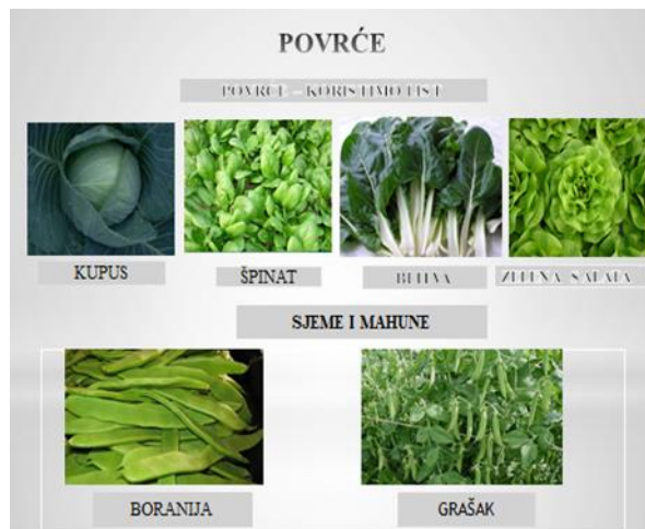
Slajd 7.: Povrće kod kojih koristimo jestivi list

Učenici/ce prepoznaju biljke i govore koji dijelovi se koriste u ishrani.