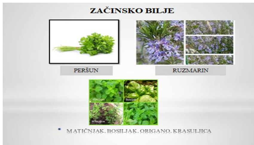
Slajd 5.: Začinsko bilje Putem Power Pointa ponoviti dijelove biljke.