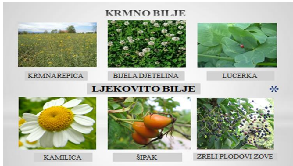
Slajd 4.: Krmno bilje i ljekovito bilje