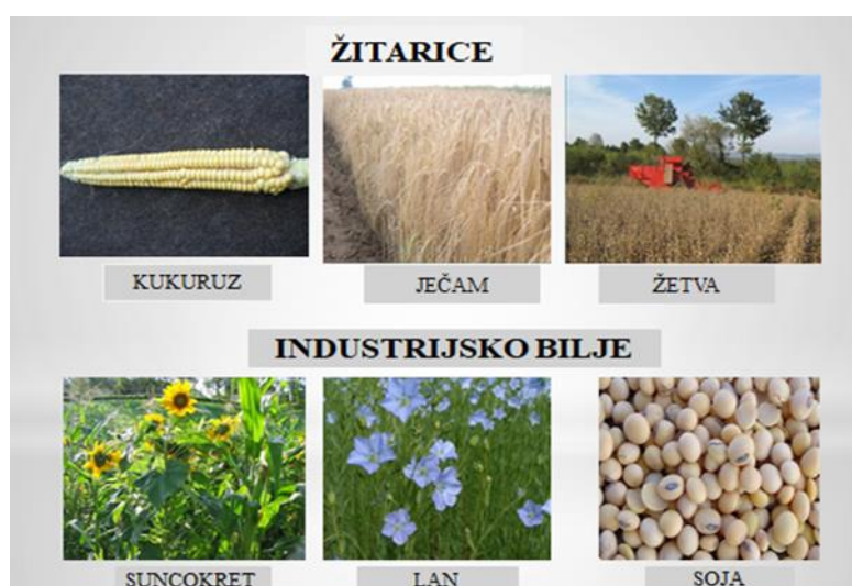
Slajd 3.: Žitarice i industrijske biljke